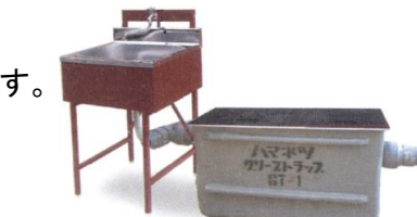
設置例/1槽式シンク+沈殿槽

材 質／本体・整流板／FRP 内部／ステンレス・ ホリ塩化ビニール・ホリエチレン